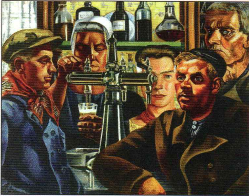
Charley Toorop, Aan de toog, 1933